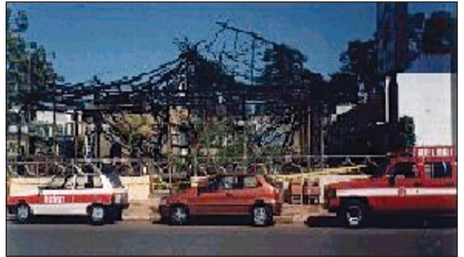
Incêndio em edificação com cobertura de fibras vegetais (ocupação de bar e restaurante)

5.5.4 Recomenda-se a utilização de sistemas de aspersão de água que visam a manter as fibras permanentemente úmidas ou destinadas ao próprio combate das chamas, sem prejuízo das demais medidas constantes desta IT.