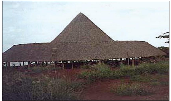
Edificação de madeira com cobertura de fibras vegetais

5.2.1 As fontes de calor que podem inflamar as fibras combustíveis devem ser isoladas e mantidas à distância, mínima, de 5 m.