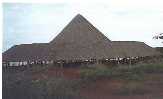
Figura 1 - Edificação de madeira com cobertura de fibras vegetais

5.1.3 A fiação que não estiver embutida em alvenaria ou concreto deve estar totalmente protegida por eletrodutos metálicos.