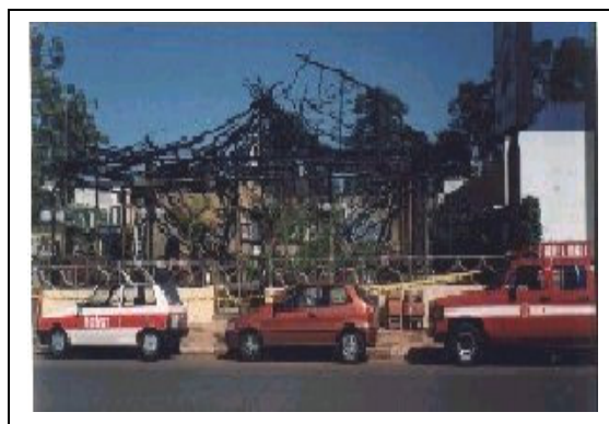
Figura 2 - Incêndio em edificação com cobertura de fibras vegetais (ocupação de bar e restaurante)

5.5.4 Recomenda-se a utilização de sistemas de aspersão de água que visam a manter as fibras permanentemente úmidas ou destinadas ao próprio combate das chamas, sem prejuízo das demais medidas constantes desta IT.